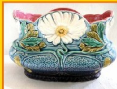
Barbotine année 1900

Au travers des collections et des oeuvres de céramique exposées, c'est au savoir-faire et au travail des faïenciers digoinais que l'on rend hommage.