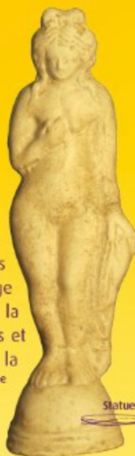
Statuette de déesse

Au fil du temps, les techniques se précisent, les décors apparaissent, d'abord sculptés puis imprimés ou peints. La fusion mythique des Eléments donne des oeuvres d'art !