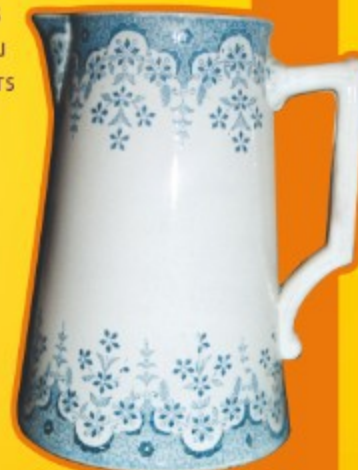
Pichet forme parisienne