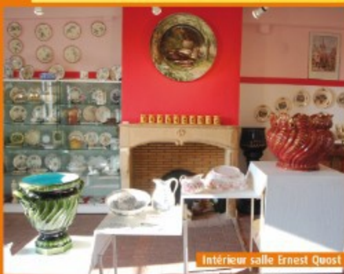
Intérieur salle Ernest Quost