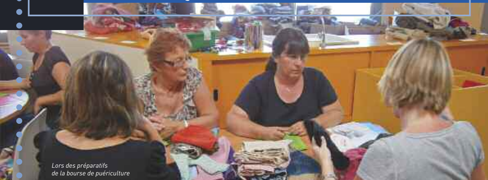
Lors des préparatifs de la bourse de puériculture