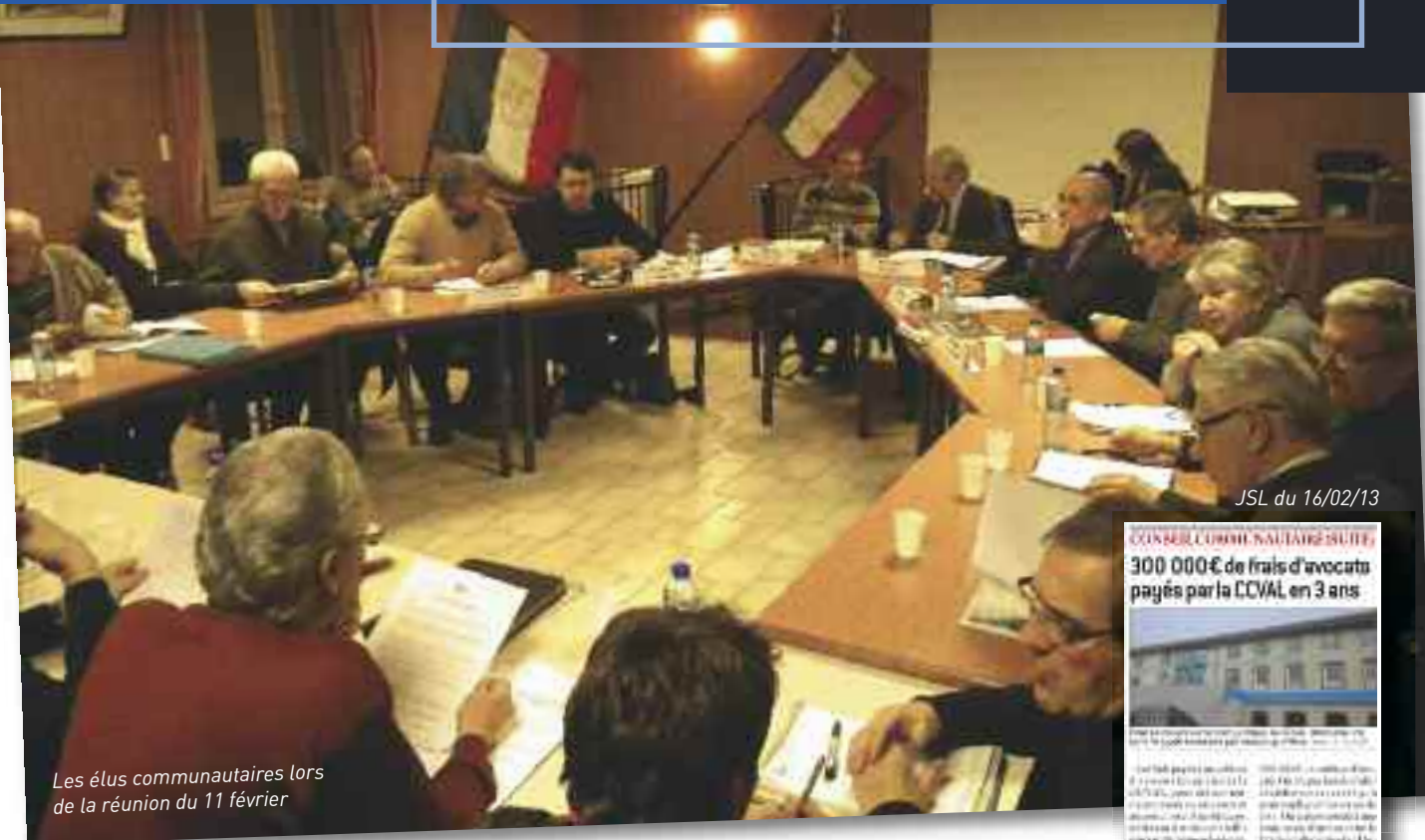
Les élus communautaires lors de la réunion du 11 février