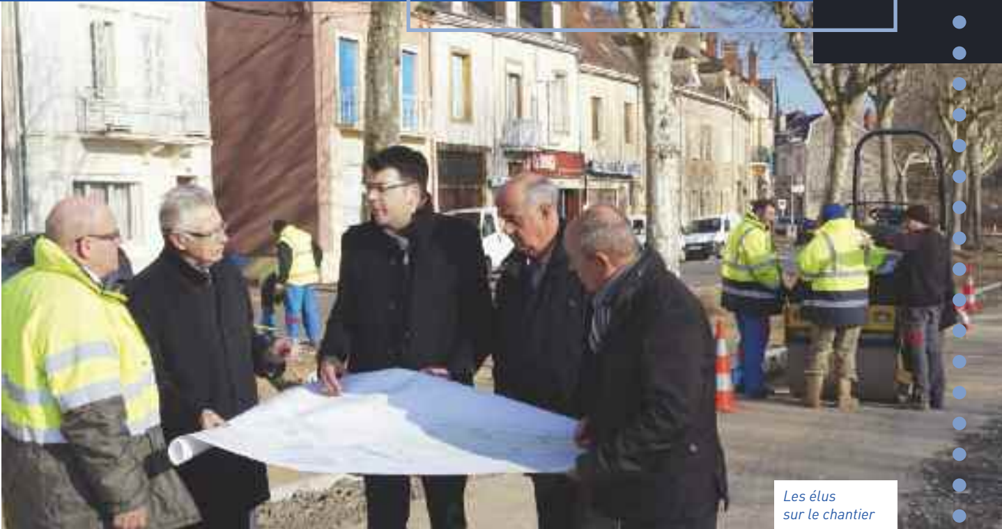
Les élus sur le chantier