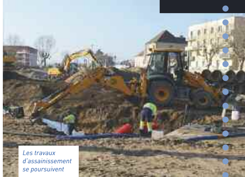
Les travaux d'assainissement se poursuivent

Prévue au Schéma Directeur d'Assainissement, il a donc été nécessaire de réaliser la réhabilitation de la canalisation ovoïde, qui traverse la Place de la Grève. Cette étape était devenue primordiale car les anciennes canalisations présentaient des traces de corrosion. À son remplacement par une canalisation DN 1000 s'ajoute une reprise des déversoirs d'orage existants qui permettra d'absorber les surplus de précipitations, souvent subis, dus aux orages afin de délester les réseaux et d'empêcher les inondations. Le montant des travaux s'élève à 486 442 € / HT. La seconde phase de travaux concerne le traitement de l'eau avec la construction d'un décanteur lamellaire permettant le traitement des eaux de déversements. Ce système relativement fiable et simple permet une dépollution efficace des eaux. Coût : 812 084 € / HT. L'ensemble des travaux bénéficie d'une subvention de l'Agence de l'eau.