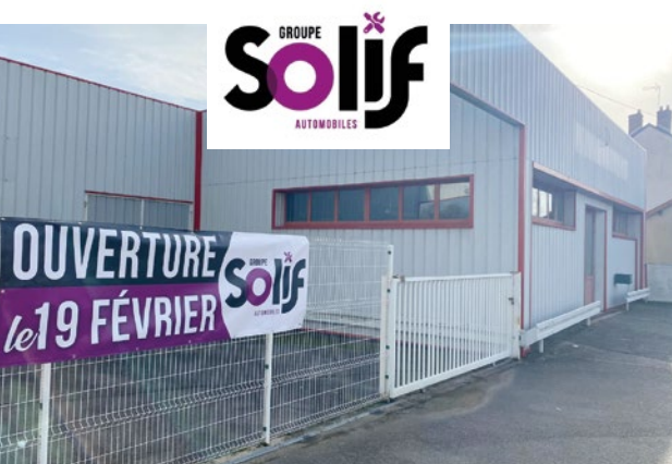
Le garage solidaire est ouvert depuis le 19 février route de la Motte