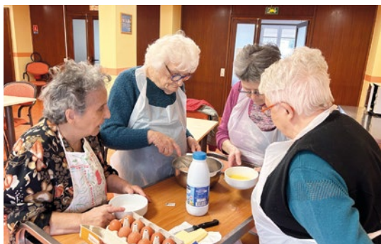
Des animations quotidiennes sont proposées pour les résidents.

La Municipalité de Digoin porte une politique engagée en faveur de ses aînés. Afin de leur permettre de profiter d'un vieillissement actif sur la commune, la collectivité ne lésine pas sur les moyens grâce à la présence de structures appropriées et d'un personnel qualifié.