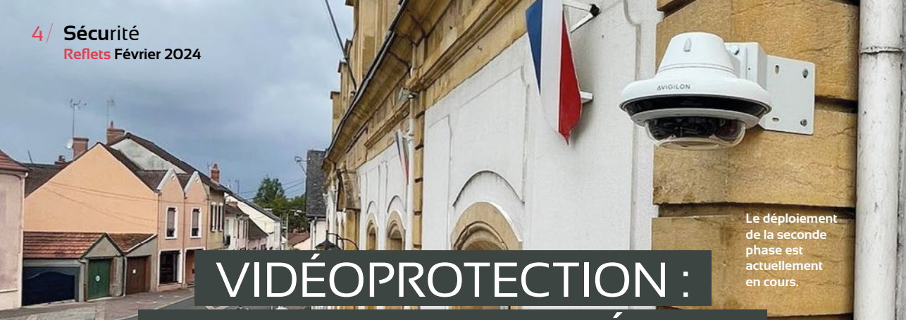
Le déploiement de la seconde phase est actuellement en cours.