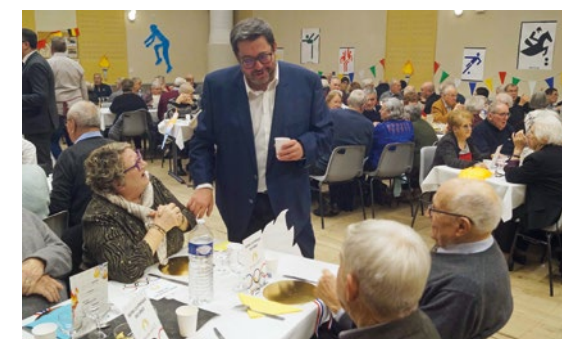
Cette journée était l'occasion de faire une pause pour se rencontrer, échanger et partager un moment festif.