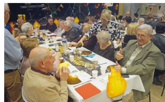
Nul doute que les convives sont déjà impatients de se retrouver dès l'année prochaine pour ce rendez-vous re(devenu) incontournable.