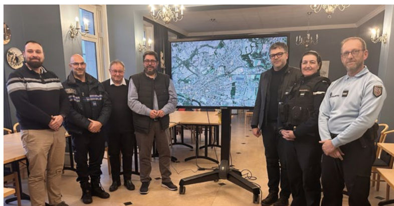
Lors de la présentation du dispositif à la presse.

« Objectif : renforcer la sécurité des biens et des personnes et permettre aux gendarmes de bénéficier des images de la vidéoprotection municipale »