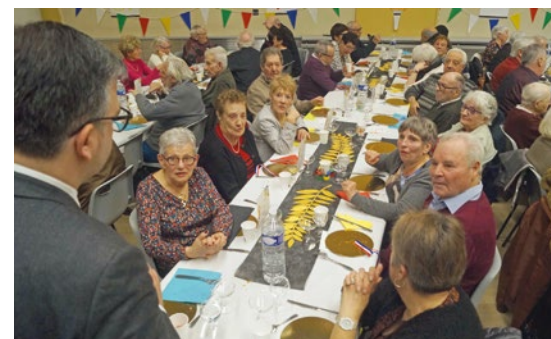
Outre les habitués qui apprécient la convivialité du moment, d'autres "nouveaux" aînés sont venus partager le repas chaleureux préparé par la Maison Dorey, le dessert préparé par l'Epi de Louis et le pain fourni par le Fournil de Sophie. Les vins ont été choisis aux « Arômes du Canal ».