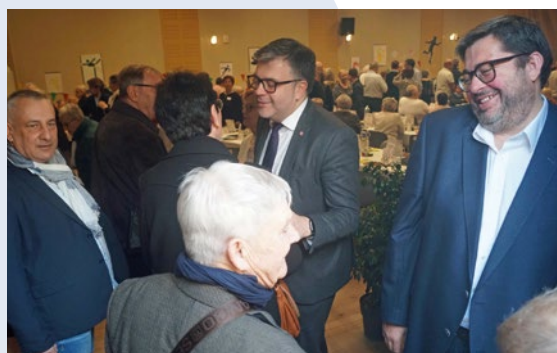
Les aînés accueillis par les élus de la Municipalité.

Il y avait comme un air de fête le dimanche 28 janvier à l'occasion du repas des aînés offert par la municipalité aux Digoinois âgés de 75 ans et plus. Ajoutez plus de 320 personnes et une ambiance musicale plein d'entrain... un bon cocktail pour une journée conviviale et appréciée de tous. Retour en images.