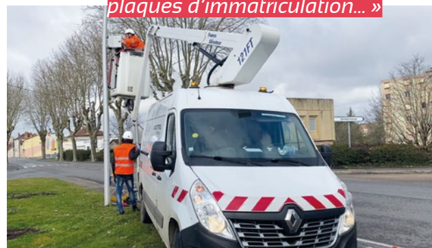
La ville de Digoin poursuit le déploiement de son dispositif de vidéoprotection, composé actuellement de 22 caméras. 21 autres seront prochainement installées sur des bâtiments publics et lieux fréquentés.

« Les premières caméras installées ont déjà permis aux gendarmes d'élucider plusieurs enquêtes, notamment en apportant des éléments de preuves comme les plaques d'immatriculation... »