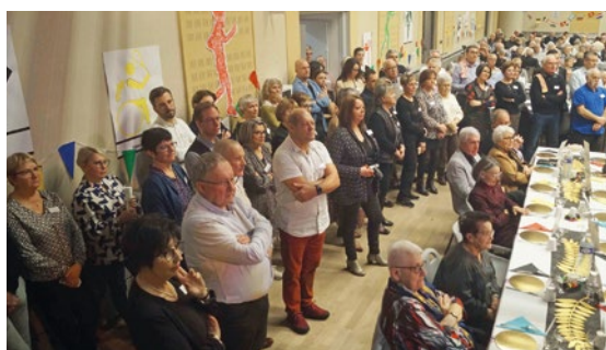
Que ce soit en cuisine, à la plonge, en salle ou au vestiaire, 72 bénévoles dont 20 conseillers municipaux étaient mobilisés tout au long de cette journée.