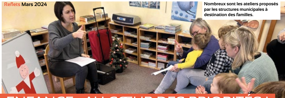
Nombreux sont les ateliers proposés par les structures municipales à destination des familles.