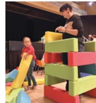
À l'image du dernier « week-end jeux en famille » qui a rassemblé des centaines de familles début mars, de nombreux rendez-vous sont proposés toute l'année par la ville de Digoin, avec la participation de bénévoles impliqués.

La commune porte donc désormais, au sein de la Maison de la Petite Enfance et de la Famille (MaPEF) rue des acacias, le « Relais petite enfance », la crèche « multi-accueil », des actions de soutien aux parents comme des entretiens avec une psychologue ou encore des animations et activités en famille... « C'est un atout de pouvoir mutualiser les équipements, certains ateliers » souligne Fabien Genet, sénateur et conseiller municipal en charge du projet municipal : « ici, c'est un lieu où tous les acteurs de la petite enfance peuvent se rencontrer, échanger... C'est également un lieu de rencontres pour les enfants en vue de préparer leur entrée à l'école... »