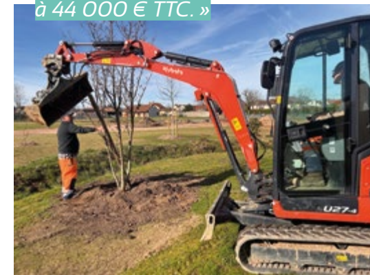
Pour un montant de 4 000 €, subventionné à hauteur de 25% par le Département 71 « chèque arbre », c'est un espace végétal qui a été totalement repensé avec l'implantation notamment d'une quarantaine d'arbres autour de la salle des capucines.

« Le montant total des nouveaux aménagements à Neuzy s'élève à 44 000 € TTC. »