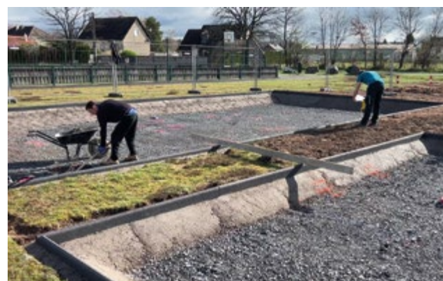
Le chantier, qui a débuté mi-novembre verra le jour au printemps 2024 (les fondations ont été réalisées en régie par les agents des services techniques de la ville de Digoïn).

« Les travaux autour de l'aire de jeux se termineront dans les tout prochains jours... »