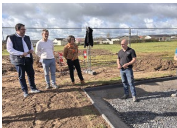
Élus et responsables de services ont fait le point sur les futures installations rue des Capucines à Neuzy.

Dans le détail, « le futur contenu de l'aire de jeux comprendra 3 espaces allant de 1 à 10 ans sur un espace de près de 120m 2 » soulignait le premier édile. « Différents toboggans, balançoires, maisonnettes et nouveaux jeux sur ressorts seront bientôt accessibles aux familles. Les matériaux proposés sont en matière recyclée et 100 % recyclable avec un sol amortissant... L'idée première était de créer un site convivial et chaleureux, favorisant les rencontres ». Un plus appréciable que la ville de Digoïn est sur le point d'offrir aux riverains.