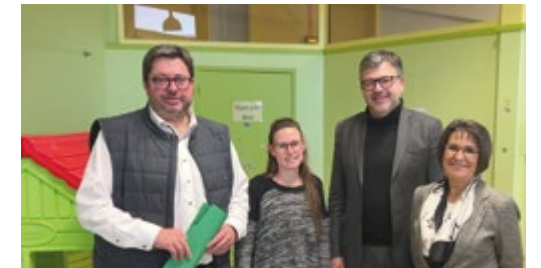
« Une structure à l'écoute des parents et des assistantes maternelles. »

En effet, depuis 2017, tous les enfants âgés de deux ans, de tous les quartiers de Digoin, peuvent être scolarisés, même « non propres » à l'école maternelle du Launay dans une classe de 18 élèves maximum spécialement dédiée et conçue pour eux. Les locaux sont adaptés pour leur âge ainsi que le matériel mis à leur disposition. La récréation se déroule dans un espace spécifique et l'enseignement est réalisé par un enseignant et ATSEM spécialement formés pour cet accueil. Pour une bonne adaptation de l'enfant, les familles sont également acteurs de leur scolarisation en passant une convention avec l'école maternelle afin de définir ensemble les modalités, les rythmes personnalisés d'accueil. (Renseignements : 03 85 53 73 31/35)