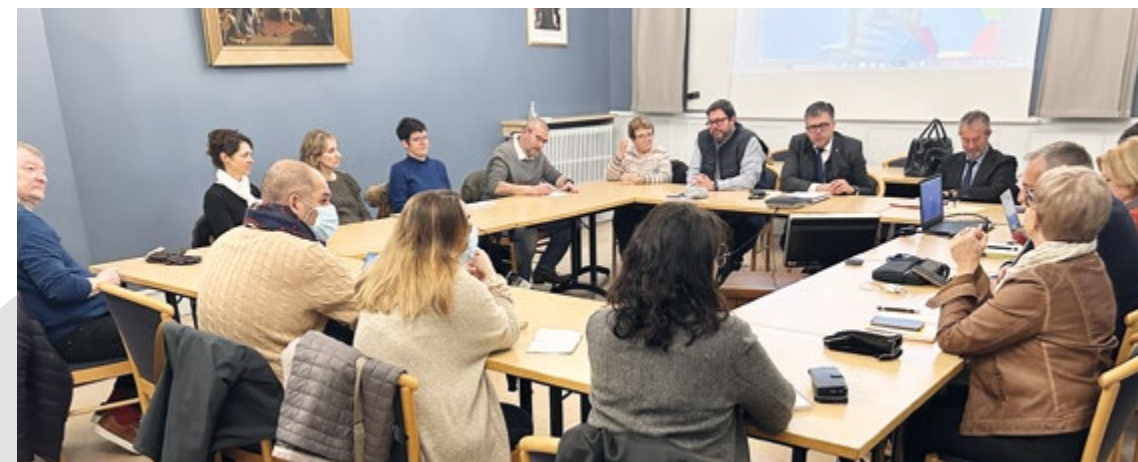
Lors de la réunion avec les élus du territoire, les professionnels de santé et l'ARS (Agence Régionale de la Santé) fin d'année 2023.