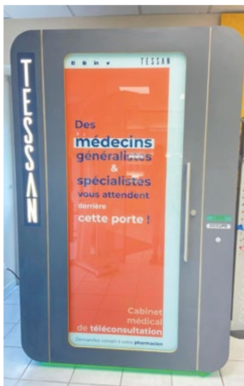
Les installations de cabines de téléconsultation se généralisent à Digoïn.

L'ensemble des résultats sont envoyés au praticien. Ce dernier établit un diagnostic et transmet (si nécessaire) une ordonnance, imprimée directement dans la cabine.