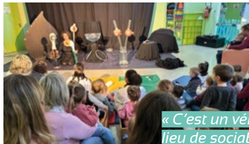
Installé dans les locaux de la Maison de la Petite Enfance et de la Famille (MaPEF) rue des acacias, le multi-accueil « Boris et Françoise Dolto » propose un accueil régulier ou occasionnel pour les enfants à partir de 2 mois.