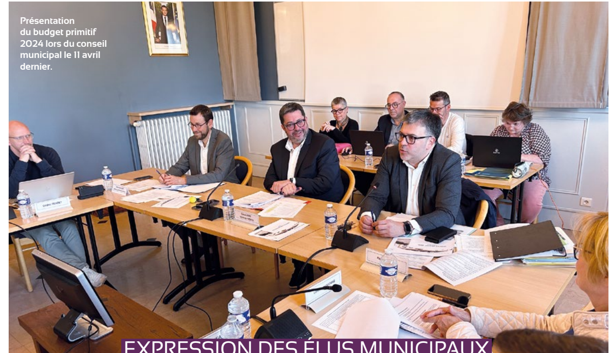
Présentation du budget primitif 2024 lors du conseil municipal le 11 avril dernier.